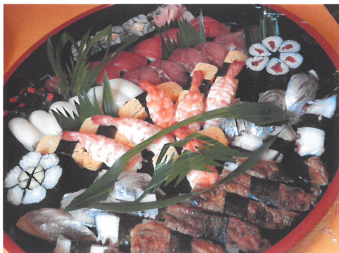
寿司盛り合わせ (予約受付)